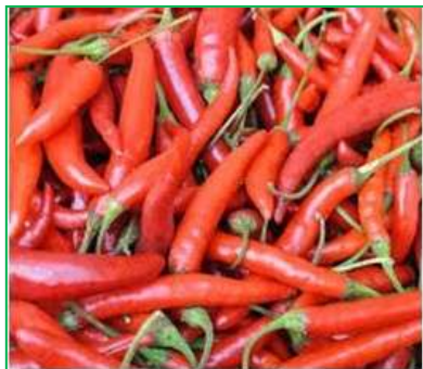
辛辣椒能製香料也有藥用

不少人喜歡吃『辛辣麵』，特別是來自韓國的品牌，如在烹調時加入適量的青菜不單增強食物的營養成份，同時可以減輕它的辣度，若再加上一點肉末，便可以為我們提供了一頓午餐。南亞和東南亞國家，如印度、泰國、印尼和中國，由於盛產能附加於膳食的香料都廣泛使用這些天然香料，得以調製不少以濃郁味道而聞名的〈菜式〉。這些國家都是發展中國家，特別在上世紀的時候，受戰爭和殖民政府的管治，人民生活頗為艱苦，這些國民除了使用本地生產價廉的香料，來豐富飯食的質量，也可以透過香料貿易來提升經濟，讓人體會創造主『...不偏待人(包括窮人)』的部份意義，只要使用合宜，山野間都充滿寶物。