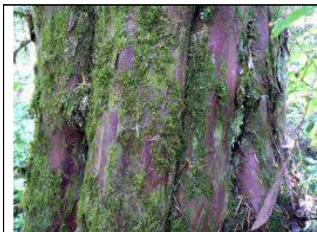
圖一：能分離紫杉醇的樹木