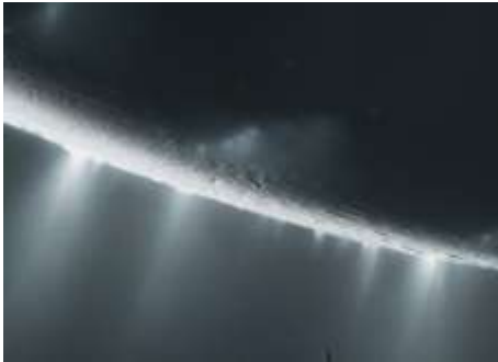
土衛二南極的噴口