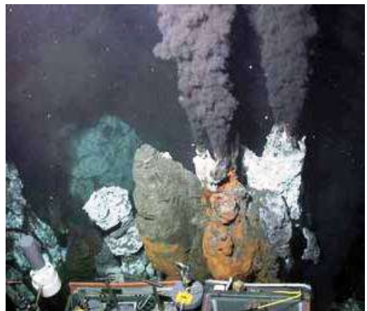
深海發現的熱噴口