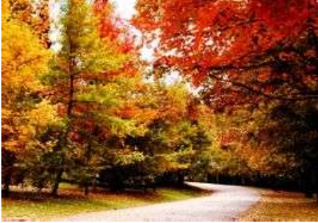
圖一:雲南昆明植物研究所