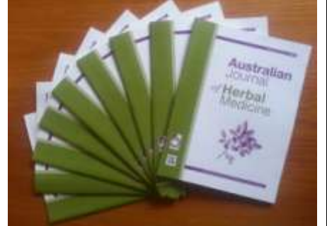
圖二:澳洲草本植物藥學學報

可使用。組織有自己出版的科學期刊<草本植物藥學學報>(圖二)，每年更會主辦<草本植物藥推廣週>，在全國不同的城市舉辦活動，讓群眾瞭解使用草本植物藥物的優點。