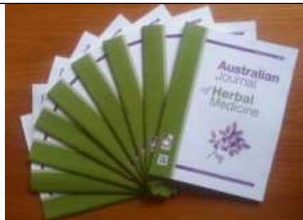
图二:澳洲草本植物药理学学报

可使用。组织有自己出版的科学期刊<草本植物药理学学报>(图二), 每年更会主办<草本植物药推广周>, 在全国不同的城市举办活动, 让群众了解使用草本植物药物的优点。