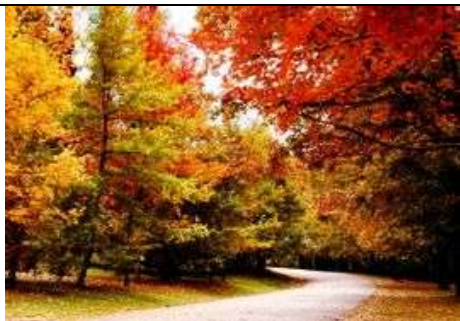
图一:云南昆明植物研究所