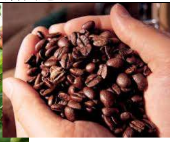
烘焙處理過的咖啡豆