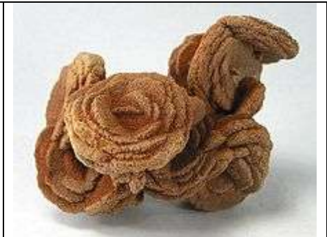
奧克拉荷馬州的沙漠玫瑰 (大小: 10.2 x 7.1 x 5.5 cm) 取自<維基百科全書>.